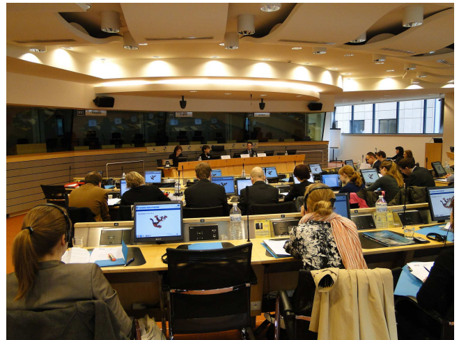
U Odboru regija

Govorilo se, također, o inovativnosti, komunikaciji i komunikacijskim tehnologijama, važnosti cjeloživotnog učenja, kao i o važnosti suradnje EU, nacionalnih vlada te regionalnih i lokalnih tijela u svrhu identifikacije korisnika.